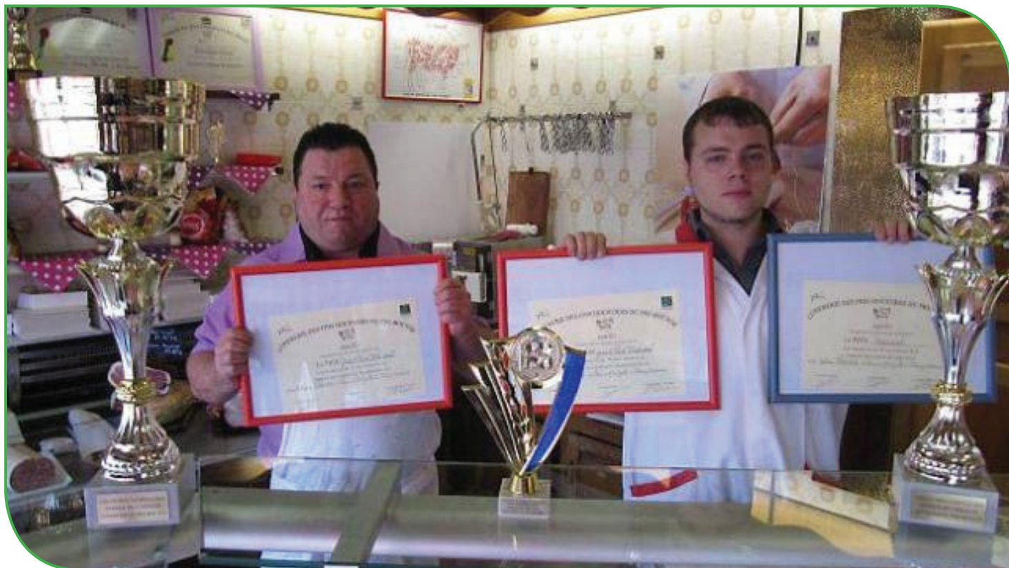
Quand l'élève dépasse le maître.