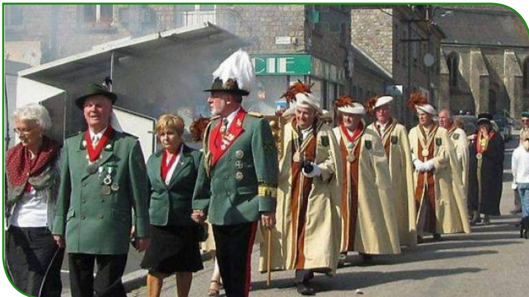
Une vingtaine de confréries de France et d'Allemagne ont défilé dans les rues.

Le public a pu admirer le cortège de la confrérie de la faisanderie de Sully-sur-Loire, les goustebourdelets du Bocage-Athésien, les Tameliers du bon pain du Calvados, les chevaliers du Livarot, la teurgoule de Normandie, les compagnons du boudin blanc de Essay, les chevaliers du Pont-l'Évêque, la véritable andouille de Vire, du Calvados et pommeau, des Goustiers de Falaise, du cochon de